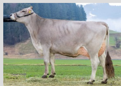
Braunvieh: VERDI Ulme