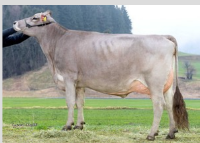
Braunvieh: VERDI Uschi