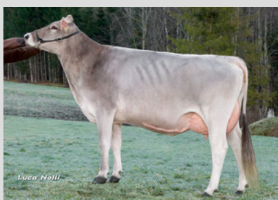
Braunvieh: PUCK Selina