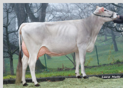
Braunvieh: PUCK Zeder