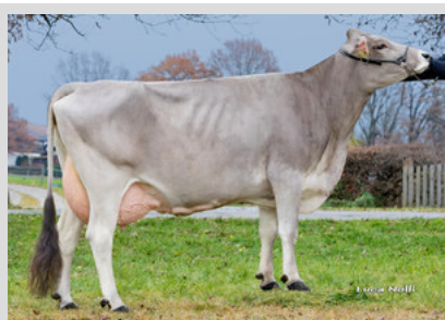
Braunvieh: HACKER - Minka 4.Lak