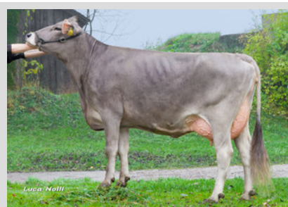
Braunvieh: HACKER - Helena